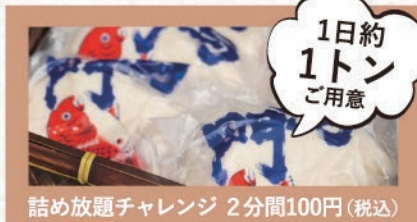
詰め放題チャレンジ 2分間100円(税込)